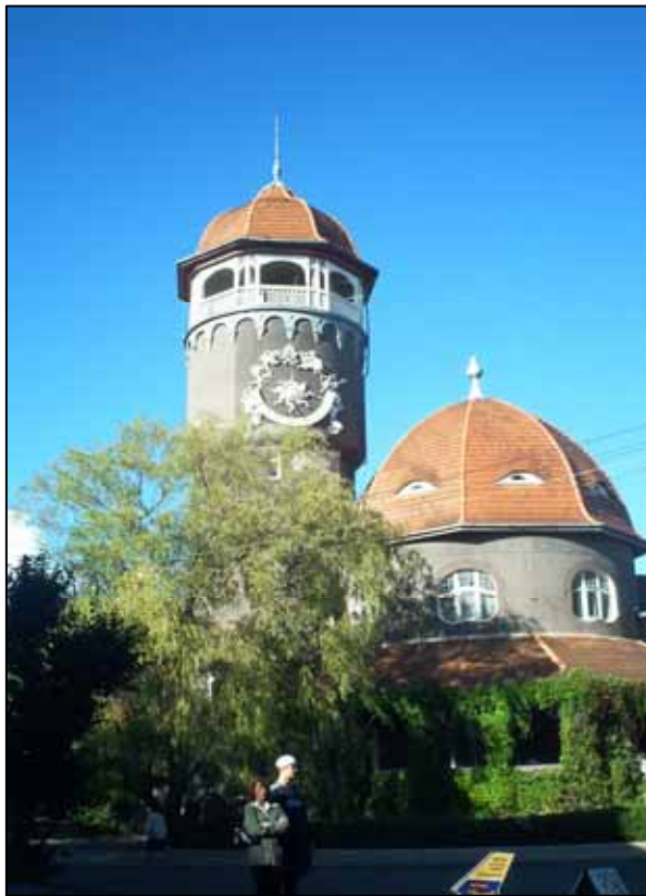
Морская водолечебница с водонапорной башней в Светлогорске

Среди них – морская водолечебница с водонапорной башней (1908 г.), дача архитектора Геринга (XX в.), кирха (XX в.), вилла (XX в.), охотничий дом, дом-музей скульптора Германа Брахерта (пос. Отрадное). На улицах Отрадного встречаются редкие виды растений (рододендроны, самшит, азалия и другие).