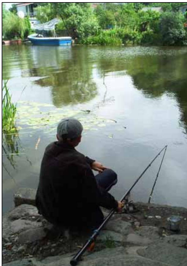
Рыбалка на реке Прохладной

На 25-м километре через поселок Береговое (зверосовхоз, разведение норок), маршрут выходит к туристическому городку в Сосновом Бору. Здесь расположено множество туристических баз. Разнообразен растительный и животный мир.